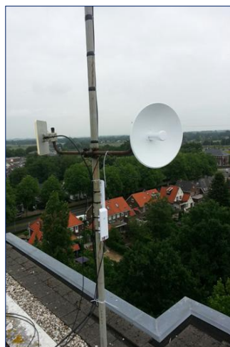
Aan de andere kant staat een schotel in Den Bosch gericht naar Eindhoven te kijken