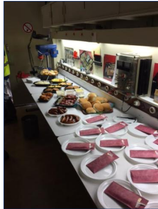
Na de evaluatie volgde een bijzonder smakelijke barbecue