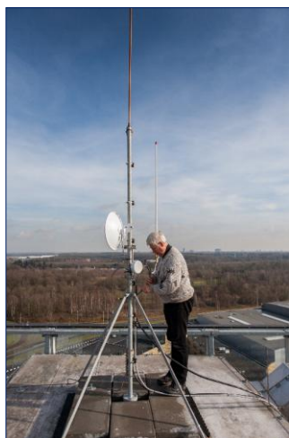
Aan de ene kant staat de schotel in Eindhoven gericht naar Den Bosch

Natuurlijk is er een speciale QSL kaart gedrukt om dit event te vieren. QSL via de RSGB, via het RAFARS QSL Bureau of SAE naar G4PSH QTH. Er wordt op gerekend dat het station van tijd tot tijd ook op 5MHz QRV zal zijn. Voor meer informatie en contact details zoek naar GB75ACO op www.grz.com