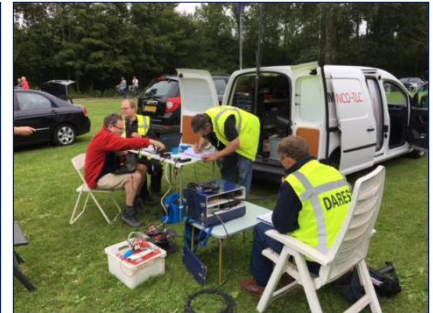
Post 3 PI9DU "Rijkswaterstaat" in actie